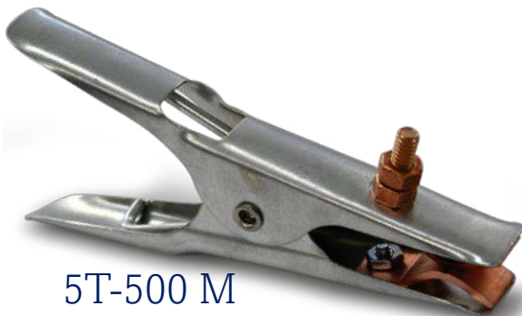
5T-500 M CAJA 24 piezas