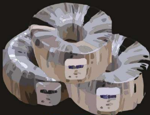
ROLLOS DE 100 MTS