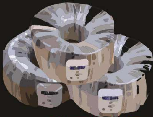
ROLLOS DE 100 MTS