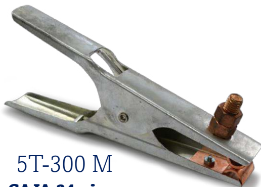
5T-300 M CAJA 24 piezas