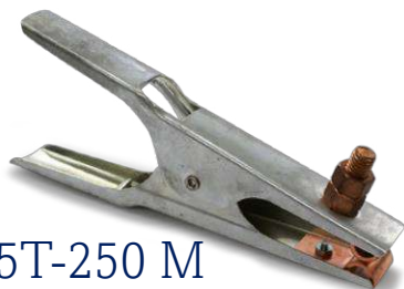
5T-250 M CAJA 48 piezas

Pinzas y tenazas de tierra, 250, 300 y 500 amperios